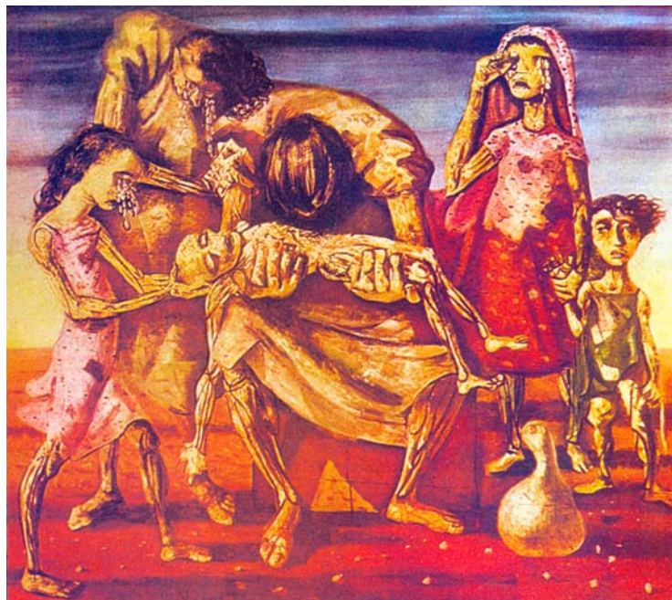
“A criança morta” (1944), da série Os retirantes , de Cândido Portinari. Disponível em: < http://coletivocultural.files.wordpress.com >. Acesso em: 3 mar. 2010.

BRITO, Ronaldo Correia de. Livro dos homens . São Paulo: Cosac Naify, 2005. p. 19-20.