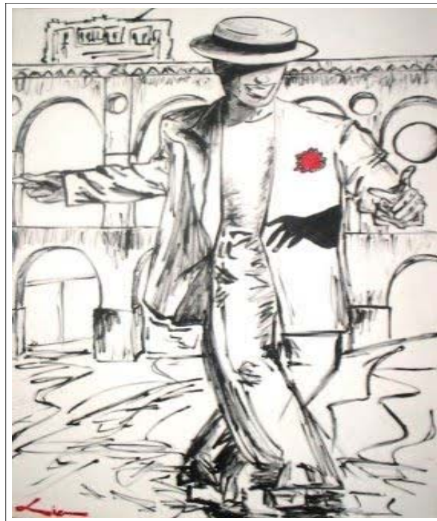
Representação do Malandro.